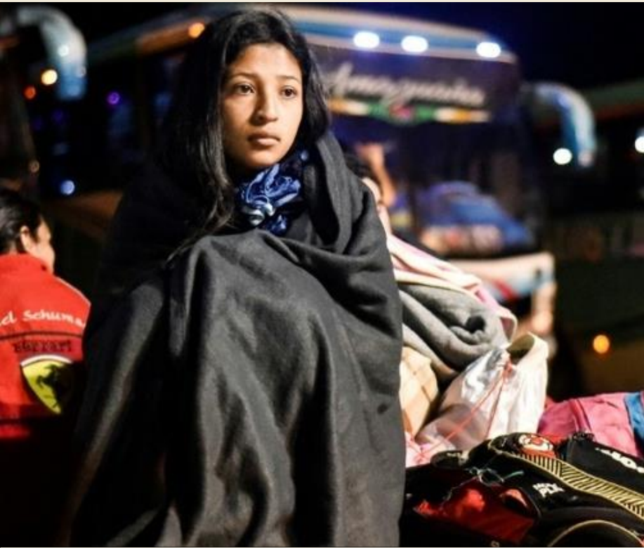
Referencia : Huaquillas, at the Ecuadorian-Peruvian border (Robayo, 2018)